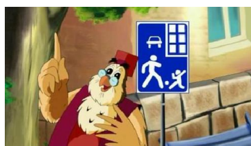
уроки тетушки Совы – Азбука дорожной безопасности